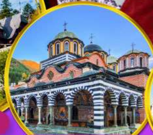
อารามมรดกโลกโรลล่า