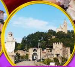
ป้อมชาเรเวทส์