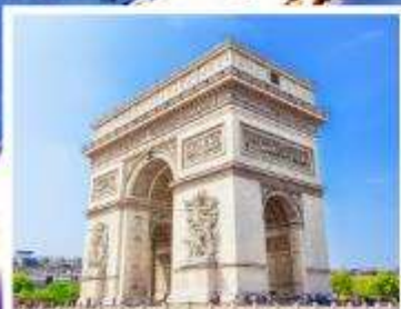
ประตูลีปารีส