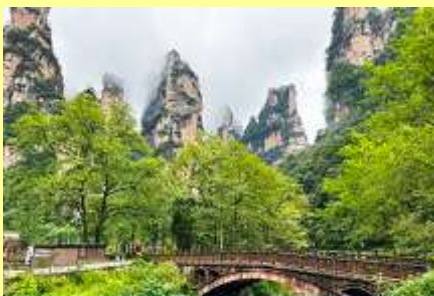
จุดชมวิวจินเปียนซี

โปรแกรมเสริมที่ 1 โปรแกรมเที่ยวชมอุทยานภูเขาอวตารแบบสั้นที่ไม่ขึ้นลิฟท์แก้ว (ผู้เข้าร่วมขั้นต่ำ 15 ท่าน) ใช้เวลาประมาณ 2-3 ชั่วโมง อัตราค่าบริการท่านละ 400 หยวนหรือ 2,000 บาท นำท่านเที่ยวชมจุดชมวิวลำธารจินเปียนซีที่สามารถมองเห็นวิวยอดเขาอวตารได้ชัดเจน นำท่านเที่ยวชมจุดชมวิวจินเปียนซี ลานชมวิวลีฟท์แก้วไปหล่งที่สามารถมองเห็นทัศนียภาพของภูเขาอวตารและลิฟท์แก้วได้ชัดเจน (ไม่ได้รวมค่าขึ้นลิฟท์แก้ว) อัตราค่าบริการรวม ค่าบัตรเข้าอุทยาน ค่ารถรับส่งภายในเขตอุทยาน ค่านำเที่ยวของไกด์ท้องถิ่น