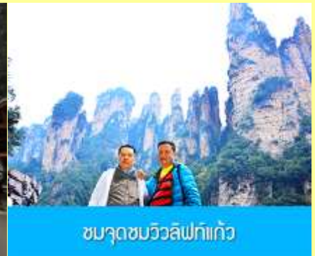
ชมจุดชมวิวลีฟท์แก้ว

โปรแกรมเสริมที่ 1 โปรแกรมเที่ยวชมอุทยานภูเขาอวตารแบบสั้นที่ไม่ขึ้นลิฟท์แก้ว (ผู้เข้าร่วมขั้นต่ำ 15 ท่าน) ใช้เวลาประมาณ 2-3 ชั่วโมง อัตราค่าบริการท่านละ 400 หยวนหรือ 2,000 บาท นำท่านเที่ยวชมจุดชมวิวลำธารจินเปียนซีที่สามารถมองเห็นวิวยอดเขาอวตารได้ชัดเจน นำท่านเที่ยวชมจุดชมวิวจินเปียนซี ลานชมวิวลีฟท์แก้วไปหล่งที่สามารถมองเห็นทัศนียภาพของภูเขาอวตารและลิฟท์แก้วได้ชัดเจน (ไม่ได้รวมค่าขึ้นลิฟท์แก้ว) อัตราค่าบริการรวม ค่าบัตรเข้าอุทยาน ค่ารถรับส่งภายในเขตอุทยาน ค่านำเที่ยวของไกด์ท้องถิ่น