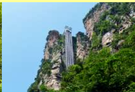
ลิฟท์แก้วไปหล่ง