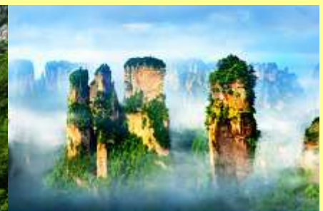
ภูเขาอวตาร

โปรแกรมเสริมที่ 2 โปรแกรมเที่ยวชมอุทยานภูเขาอวตารแบบครึ่งวันที่รวมค่าขึ้นลิฟท์แก้ว (ผู้เข้าร่วมขั้นต่ำ 15 ท่าน) ใช้เวลาประมาณ 4-6 ชั่วโมง (ขึ้นอยู่กับจำนวนนักท่องเที่ยวในแต่ละวัน) อัตราค่าบริการท่านละ 750 หยวนหรือ 3,750 บาท นำท่านเที่ยวชมจุดชมวิวลำธารจินเปียนซีที่สามารถมองเห็นวิวยอดเขาอวตารได้ชัดเจน นำท่านเที่ยวชมจุดชมวิวจินเปียนซี ลานชมวิวลีฟท์แก้วไปหล่งที่สามารถมองเห็นทัศนียภาพของภูเขาอวตารและลิฟท์แก้วได้ชัดเจน นำท่านขึ้นลิฟท์แก้วขึ้นสู่ยอดเขาอวตาร นำท่านเดินชมจุดชมวิวจินเปียนซี ลานชมวิวลีฟท์แก้ว ภูเขาอวตาร ได้แก่ภูเขาฮาเลลูย่า สะพานหนึ่งในได้หล่า... อัตราค่าบริการรวม ค่าบัตรเข้าอุทยาน ค่ารถรับส่งภายในเขตอุทยาน ค่านำเที่ยวของไกด์ท้องถิ่น