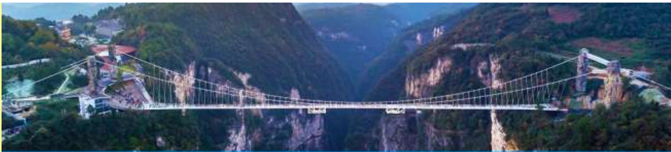
สะพานกระจกข้ามหุบเขาแกรนด์แคนยอน

โปรแกรมเสริมที่ 3 โปรแกรมเที่ยวชมสะพานกระจกพร้อมหุบเขาแกรนด์แคนยอนจากเจียเจีย (ผู้เข้าร่วมขั้นต่ำ 15 ท่าน) ใช้เวลาประมาณ 2-3 ชั่วโมง (ขึ้นอยู่กับจำนวนนักท่องเที่ยวในแต่ละวัน) อัตราค่าบริการท่านละ 400 หยวนหรือ 2,000 บาท นำท่านเที่ยวชมสะพานกระจกที่สร้างล้อมหุบเขาที่ยาวที่สุดในโลก ทำความกล้าของท่านด้วยการเดินบนพื้นกระจกใสที่สามารถมองเห็นก้นเหวลึกที่อยู่เบื้องล่าง....อัตราค่าบริการรวม ค่าบัตรเข้าอุทยาน ค่ารถรับส่งภายในเขตอุทยาน ค่าน้ำดื่มของไกด์ท้องถิ่น