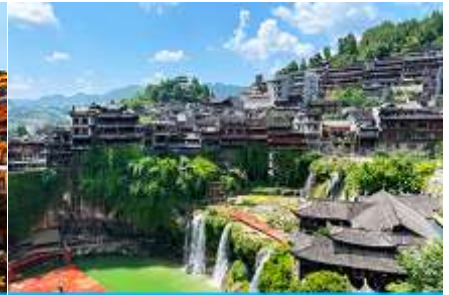
เมืองโบราณฝูหรงเจิ้น

วันที่สาม เมืองจางเจียเจี๋ย-ศูนย์จำหน่ายผลิตภัณฑ์ยวพารา-ตึกมหัศจรรย์ 72 ชั้น-เมืองโบราณฝูหรงเจิ้น ยามค่ำคืน