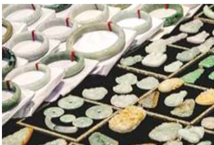
ศูนย์จำหน่ายผลิตภัณฑ์หยก

พักที่ ZHENMIAN HOTEL โรงแรมระดับ 4 ดาวหรือเทียบเท่า