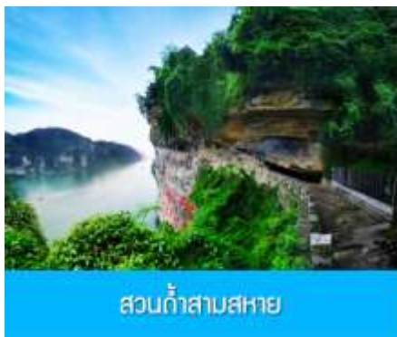
สวนถ้ำสามสหาย