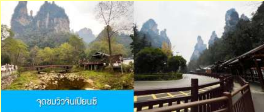
จุดชมวิวจินเปียนซี

หลังอาหารเช้าให้ท่านพักผ่อนตามอัธยาศัยในโรงแรม หรือ ท่านสามารถเลือกซื้อโปรแกรมเสริม OPTIONAL TOUR รายการใดรายการหนึ่ง ซึ่งเป็นโปรแกรมท่องเที่ยวที่ไม่ได้รวมอยู่ในรายการท่องเที่ยว ซึ่งมีด้วยกัน 3 โปรแกรม ได้แก่