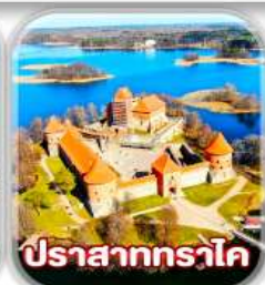
ปราสาททราโค