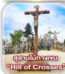
สุสานไม้กางเขน "Hill of Crosses"