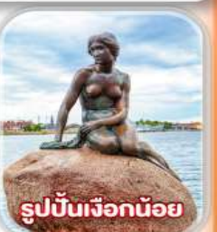
รูปปั้นเจ็คน้อย

พิเศษ! ล่องเรือสำราญ Silja line และ DFDS พร้อมค้างคืน 1 คืน ห้องวิวทะเล