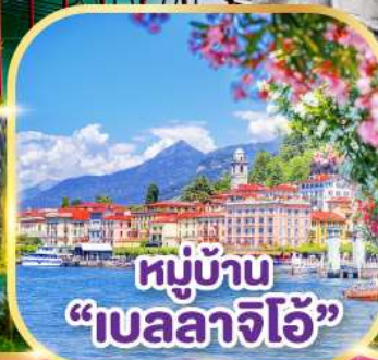
หมู่บ้าน "เบลลาจีโอ"