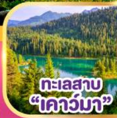
ทะเลสาบ "เคาว์มา"