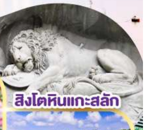
สิงโตหินแกะสลัก