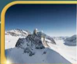
ยอดเขาจุงเฟรา

กระเช้าไอเกอร์ : ยอดเขาจุงเฟรา | กระเช้า : ยอดเขาโคลน์แมทเทอร์ฮอร์น กับ ดินแดนหมู่บ้านซิงเกวแตรัส