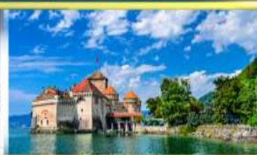
ปราสาทซิลยง