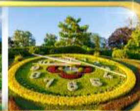
นาฬิกาดอกไม้เมืองเจนีวา

เดินทาง 9 วัน 6 คืน 09-17 ก.พ.69 22-30 มี.ย.69