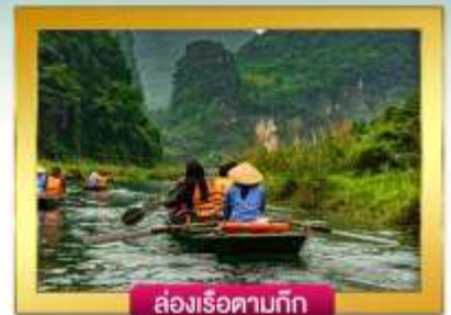
ส่องเรือตามกัท