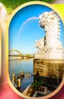
คาร์พีดราท็อน