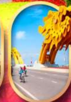
สะพานมังกร