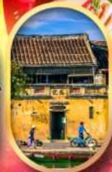
เมืองเก่าฮอยอัน