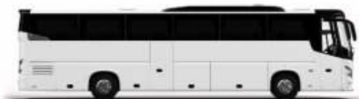
ตัวอย่างรูปภาพรถ 1 ชั้น

หากประเภทห้องที่ท่านริเคเวสมาเต็ม อาทิ เช่น ริเคเวสห้องพักเป็น TWIN BED หรือ DOUBLE BED ทางบริษัทของสวนสิทธินำในการปรับประเภทห้องพัก เป็น ตามที่โรงแรมมีอยู่ โดยไม่ต้องแจ้งให้ทราบล่วงหน้า