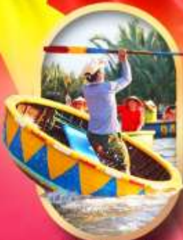
ล่องเรือกระดัง