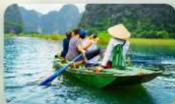
Ninh Binh ล่องเรือตามทิว