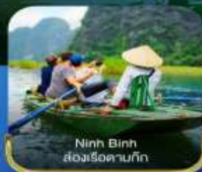
Ninh Binh ส่องเรือตามกัก