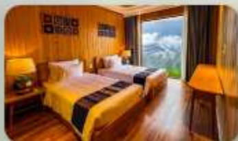
Lady Hills Sapa โรงแรมระดับ 5 ดาว 2 คืน