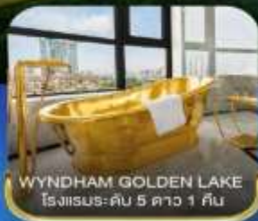
WYNDHAM GOLDEN LAKE โรงแรม-คัน 5 ดาว 1 คืน