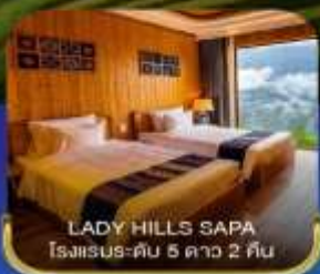
LADY HILLS SAPA โรงแรม-คัน 5 ดาว 2 คืน