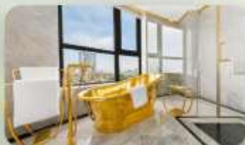
WYNDHAM GOLDEN LAKE โรงแรมระดับ 5 ดาว 1 คืน