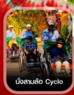
นั่งสามล้อ Cyclo